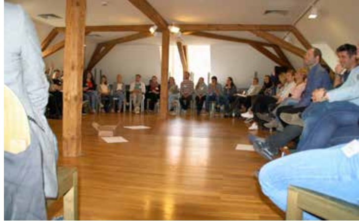
Seminare im Dachgeschoss unter historischen Balken: der Tagungsraum